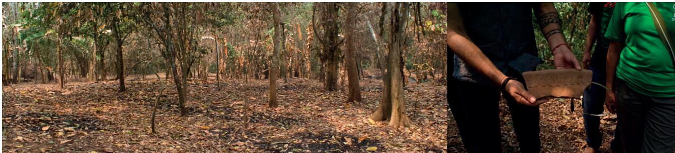
El Cerrito - Fotos: Marton Hardy / WCS