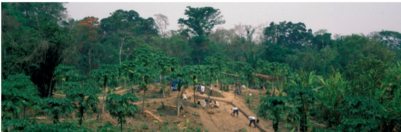
Loma Salvatierra.

El municipio de Trinidad se encuentra en una de las regiones arqueológicas más importantes de Bolivia y concentra algunos de los sitios monumentales más relevantes del Departamento del Beni. El paisaje arqueológico de la región evidencia una larga historia de ocupación humana y manejo del entorno por sociedades prehispánicas que, mediante la construcción de grandes montículos artificiales, caminos o calzadas elevadas, canales y sistemas de drenaje, dejaron una huella perdurable en las pampas benianas.